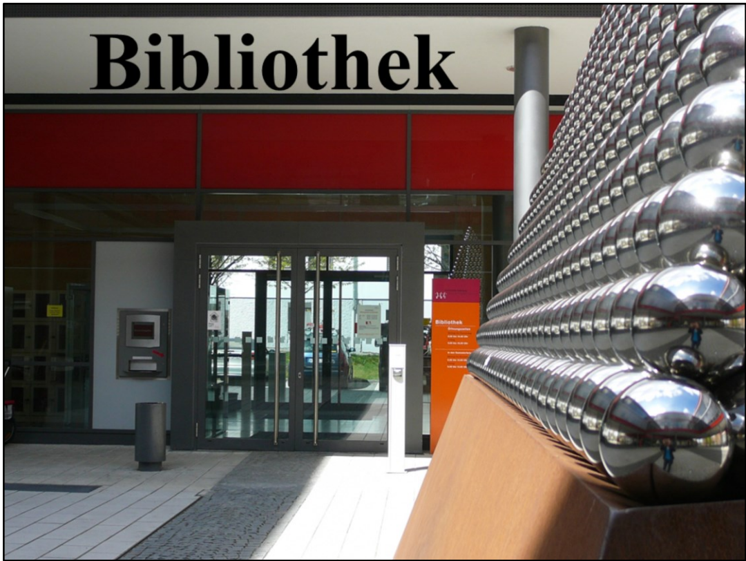
Unser Bibliothekshaupteingang an der Pyramide